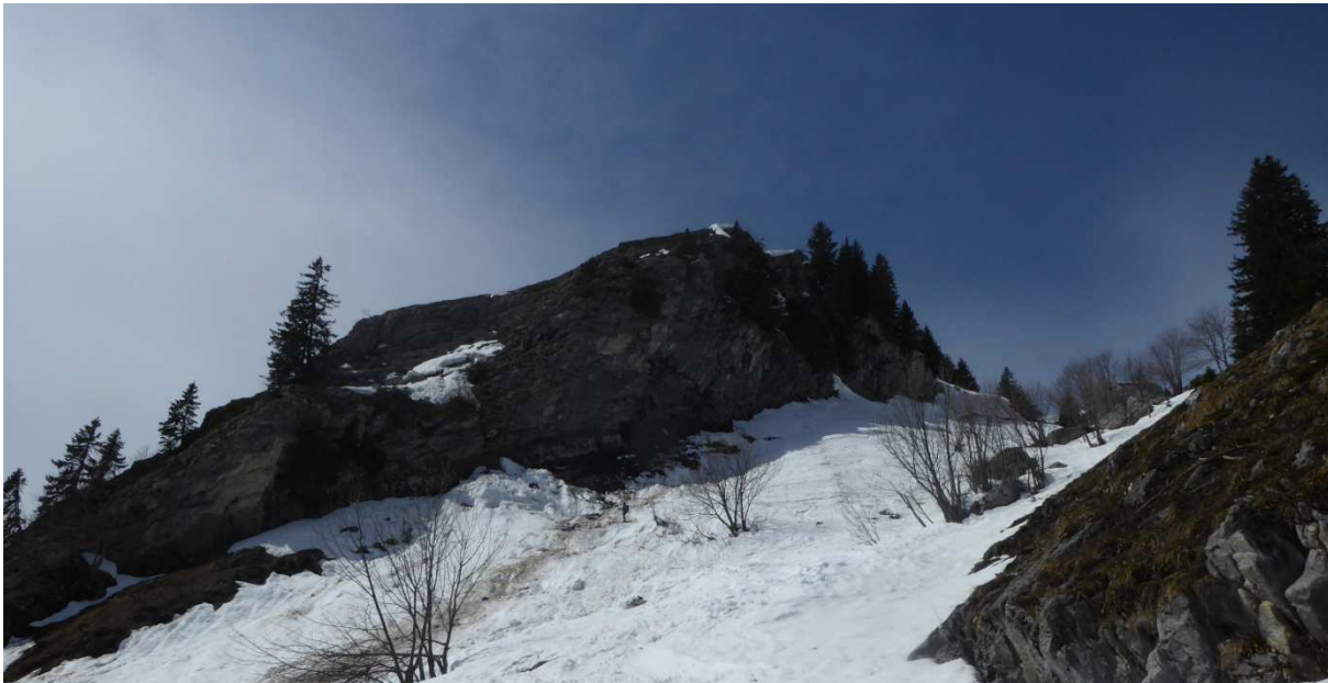
Fin de la descente... !!!!