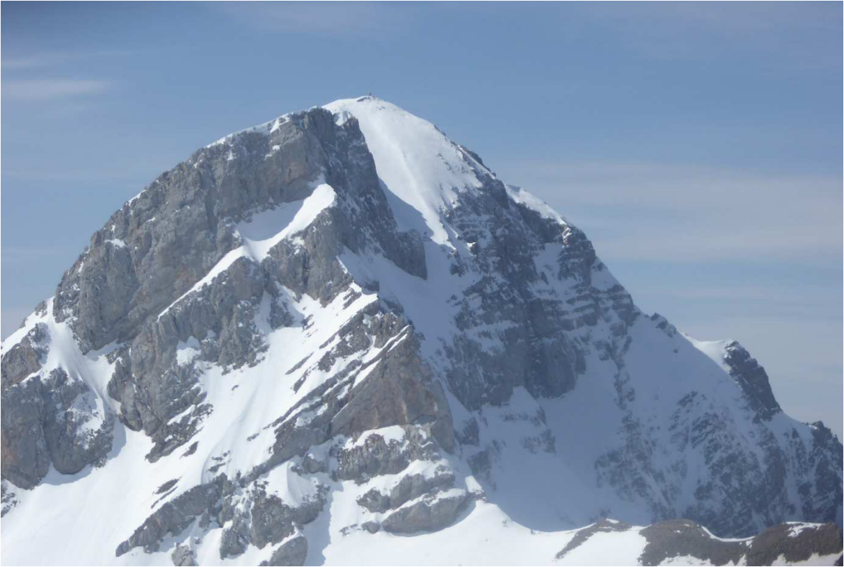
Début de la descente...