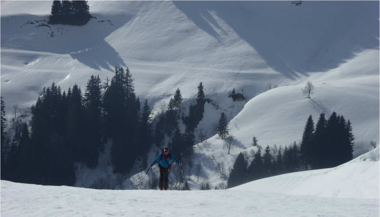
Mon compagnon du jour avec une splendide météo